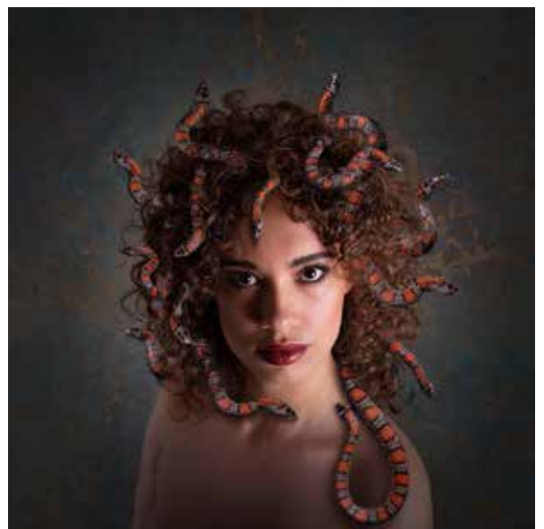
VAN BOVEN NAAR BENEDEN: HOLLANDS WELVAREN, SPIEGELOGIE EN MEDUSA