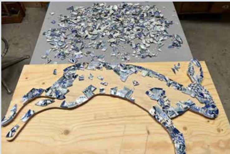
HAAS IN WORDING

Delfts Blauw is altijd al een grote liefde van me geweest. Toen bij een windvlaag mijn mooie porseleinen theeservies aan diggelen viel, moest ik daar wat mee. Ik heb er een pauw van gemaakt, die inmiddels in DNG is verkocht. De rammelende haas heb ik in dezelfde periode gemaakt, en er volgen er meer.