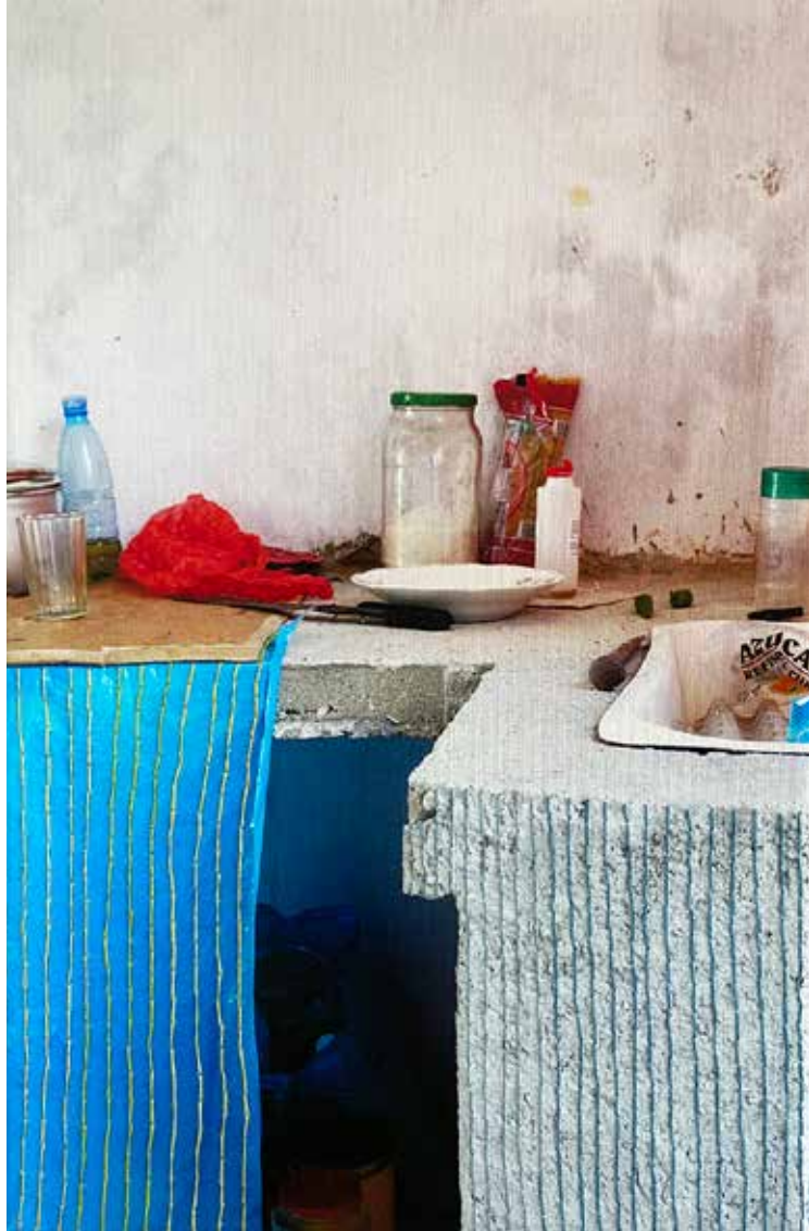
FOTO MET BORDUURWERK