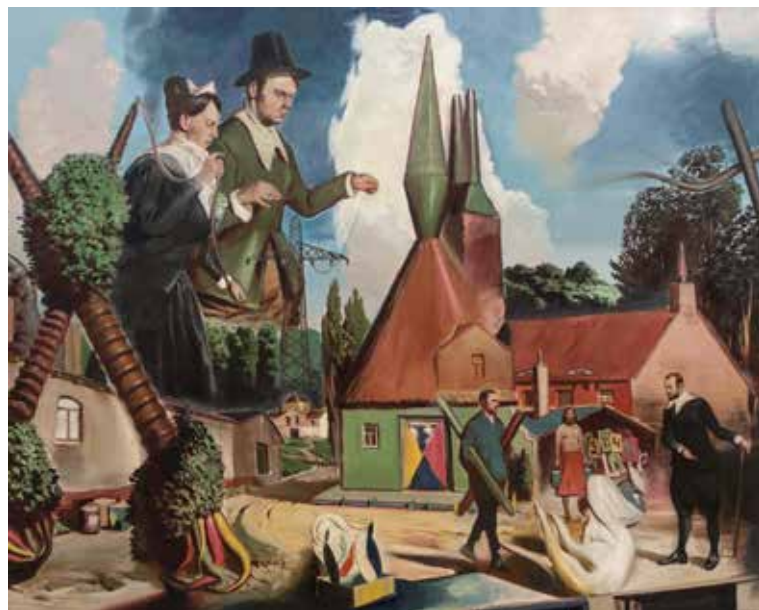
NEO RAUCH ZUSTROM (TOEVLOED) | 2016 200 X 250 CM | OLIE OP CANVAS

Neo Rauch, die op enorme lappen linnen zijn moeilijke leven als een reeks nachtmerries in verf vertaalde. Duidelijk minder virtuoos in het verfgebruik, maar wauw... wat een binnenwereld. En een stijl, die zo goed bij al zijn doorleefde narigheid past en zo persoonlijk en herkenbaar Rauch is en niemand anders!