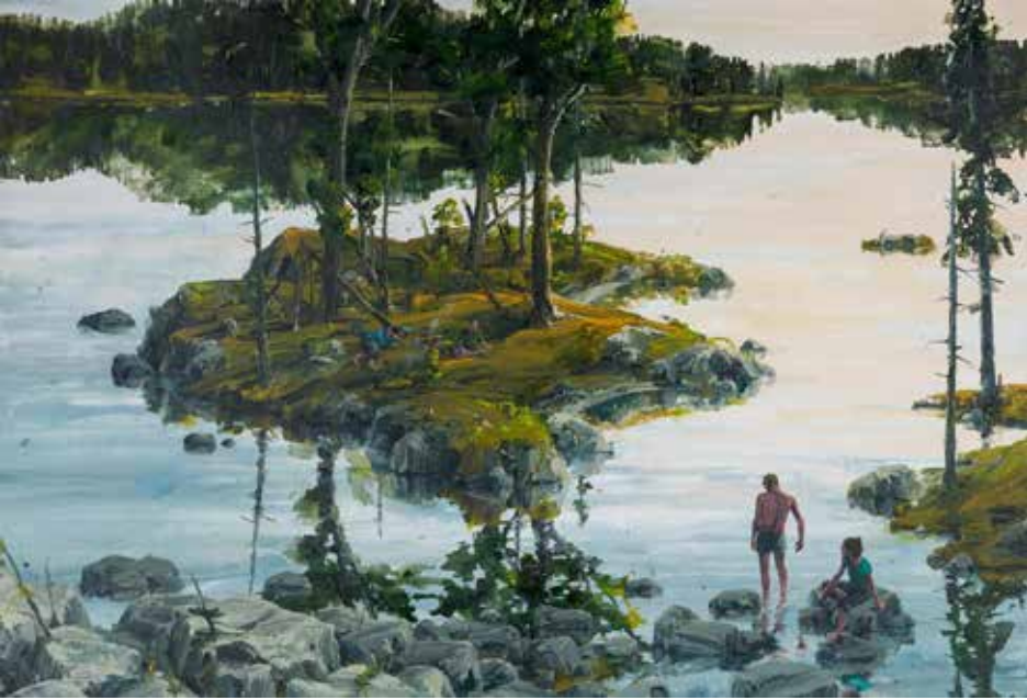
SVEN KRONER O.T. 2005 190 X 280 CM ACRYL OP CANVAS