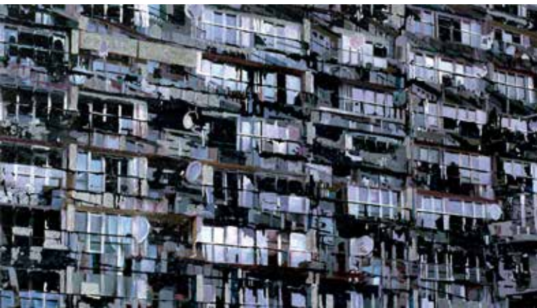
TJEBBE BEEKMAN PALAST | 2005 119 X 210 X 5 CM ACRYL, ACRYLEMULSIES EN ZAND OP DOEK GEMONTEERD OP HOUTEN PANEEL - INGELIJST

Als kunsthistorica was er natuurlijk geen ontkomen aan. Ik heb eindeloos gekeken naar het werk van grote en minder grote schilders uit verleden en heden. Daarmee heb ik echt wel een geoefende blik gekregen. En zeker na mijn opleiding Tekenen en Schilderen - die ik pas later ben gaan volgen - is het besef ten volle doorgedrongen, dat goede kunst gekenmerkt wordt door vakmanschap en de oprechte betrokkenheid van de kunstenaar bij zijn onderwerp. Het gaat er niet om wát je schildert, het gaat er om hóe je dat doet. Ik voel me vooral aangesproken door de schilderkunst, omdat de motoriek van de kunstenaar daar nu eenmaal een grote rol in speelt. Die verradt de persoonlijkheid van de maker. Ik bewonder veel schilders en noem er een paar.