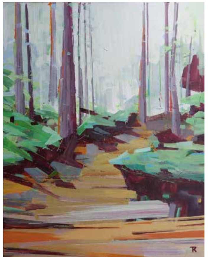
TJITS VAN DER KOOIJ WE ZIJN PAS HALVERWEGE | 2021 50 X 40 CM ACRYL OP KATOEN