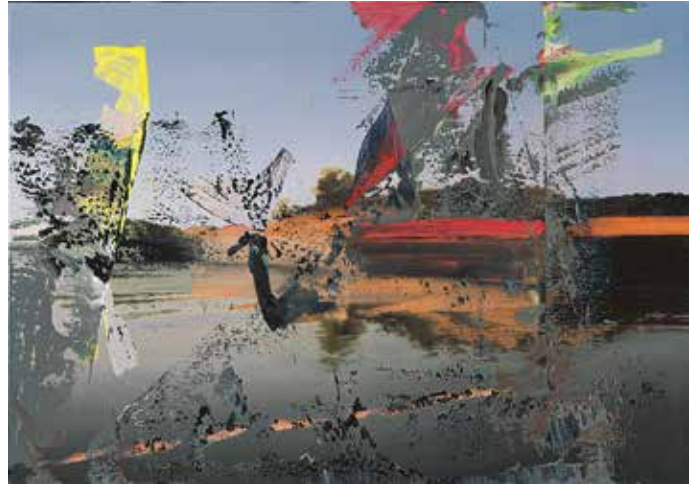
GERHARD RICHTER VENEDIG | 1986 86 X 121 CM | OLIE OP CANVAS

Dan Gerhard Richter, die vooral de abstracte eigenschappen van kleur, vorm, kwasthantering etc. onderzocht om de zeggingskracht van de verf te kunnen optimaliseren. Fantastisch: de experimenten verwijzen naar niets dan zichzelf. Je kan er dus heel goed van leren schilderen. Net als hijzelf, kun je zijn bevindingen in realistisch werk toepassen. Dat van hem is natuurlijk ijzersterk.