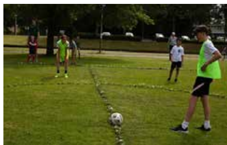
BUITENSPEL | 2022 | 105 X 68 METER | 1000-EN MADE- LIEFJES

Ook in het werk van Bart Eysink Smeets worden observaties uit het dagelijks leven verbeeld met een glimlach en wordt op een speelse manier een ander perspectief geboden. Als mens hebben we de behoefte om de natuur naar onze hand te zetten. Zo ook 'Buitenspel': duizenden madeliefjes zijn gezaaid ter markering van het voetbalveld op het Belcampplantsoen. Maar, hiermee worden ook direct de rollen omgedraaid; de madeliefjes scheppen nu de kaders voor het spel.