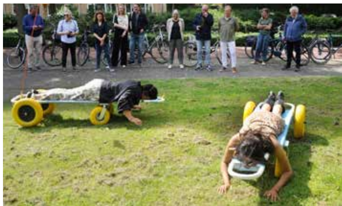
CIRCUS ANDERSOM GEGROND

Het kunstenaarscollectief Circus Andersom ontwikkelt ontregelende én verbindende projecten waarbij zogenaamde vanzelfsprekendheden net even van de andere kant worden bekeken. In 'Gegrond' wordt letterlijk een ander perspectief geboden op de bodem waarop we leven. Door plaats te nemen op een Grondmobiel, kunnen bezoekers enkele centimeters boven de bodem voortbewegen en de wereld bij de grond van heel dichtbij observeren.