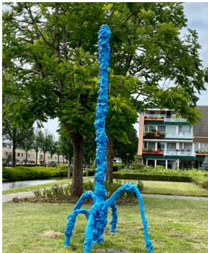
ROBBERT WEIDE PLEASURE OF THE PRECARIOUS | MIXED MEDIA

Robbert Weide maakt kunst waarin hij het absurde van het alledaagse verbeeldt. In zijn sculpturen laat hij met een knipoog geluk en ongeluk samenkomen. In 'Pleasure of the Precarious' wordt het (on)geluk verbeeld dat zich voltrekt wanneer tijdens het graven in de grond een pijpleiding wordt geraakt. Het water spuit hoog uit een putdeksel de lucht in. Is dit een ramp, of kun je dit zien als een prachtige fontein? Door situaties op een andere manier te bekijken, ben je in staat om je eigen omgeving te creëren.